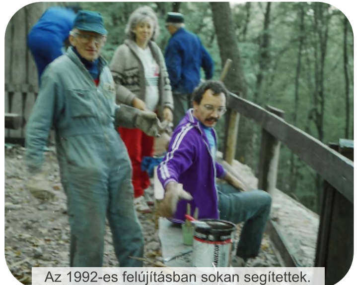
Az 1992-es felújításban sokan segítettek.

Ha jól emlékszem, talán 2006-2007 körül hozta fel Dobogókőre a Siketek Osztálya azt a három kartoncsíkot, amiken az osztály korábbi, fellelt jelvényeiket őrizte. Ezeket a korabeli felvarróval együtt elhelyeztük a régi menedékházból kialakított turista múzeum kisebbik termébe, ahol az MTE egyéb relikviáit is őrizték. A