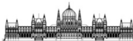
ALAPVETŐ JOGOK BIZTOSÁNAK HIVATALA AZ ENSZ NEMZETI EMBERI JOGI INTÉZMÉNYE

Előző számban beszámoltam az Állampolgári Jogok Biztos Hivatala Fogyatékosügyi Tanácsadó Testülete (ÁJBH FTT) alakuló üléséről.