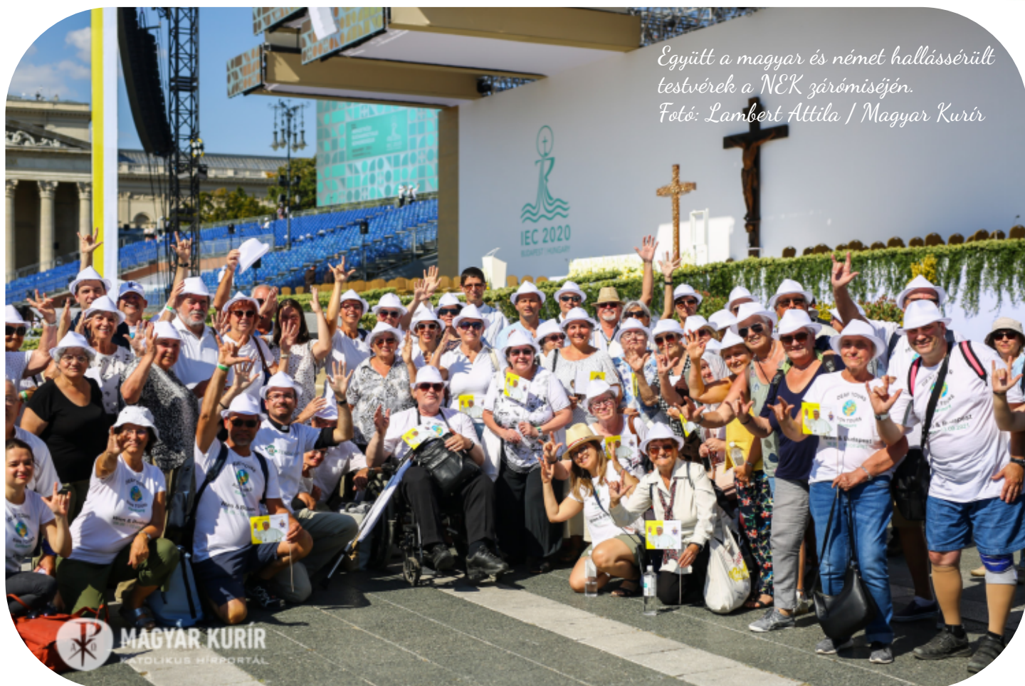
Együtt a magyar és német hallássérült testvérek a NEK zárómiséjén.