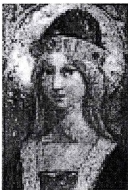
Helen Keller (1880-1968)