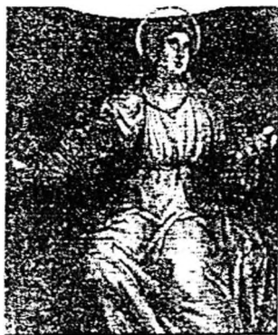
Szent Balbina vértanú és szűz

Szent Balbina római előkelő lány volt, az első században élt. Apjával együtt kérte a keresztséget Balbina. I.