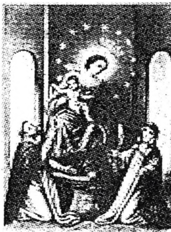
A Szűzanya átadja a domonkosoknak a rózsafüzért

A rózsafüzér így a legjobb fegyver a sátán ellen.