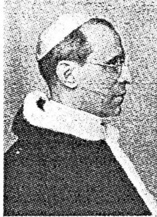
XII. Pius pápa

Israel Zolli főrabbi is nagy hálával köszönte XII. Pius pápa segítségét, amit a zsidókért tett. Amikor Zolli főrabbi megkeresztelkedett, akkor az Israel név helyett XII. Pius pápa nevét kérte keresztnevének. XII. Pius pápa civil neve volt: Eugenio (magyarul Jenő) Pacelli. A megkeresztelkedett Zolli neve: Eugenio Zolli lett