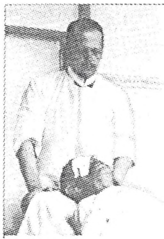
Batthyány Strattmann László

Batthyány Lászlót a szegények szemorvosának nevezik. 1870-ben született, 1931-ben halt meg nagy szenvedések között veserákban. A Vatikánban megvizsgálták Batthyány életét, működését. Megvizsgálták a csodálatos gyógyulást, ami 12 évvel ezelőtt történt egy rák-beteg, gyógyíthatatlan férfival. A férfi ma is él egészségesen.