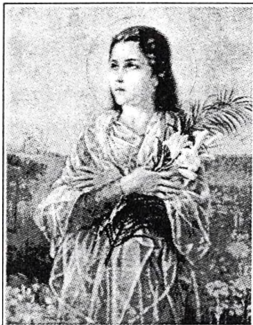
Goretti Szent Mária a szüzi tisztaság vértanúja

1902 július 6-án halt meg Goretti Szent Mária 12 éves korában. Vad erőszak ölte meg, mert védte a tisztaságát egy fiatalembertől. A szomszéd fiú több késszúrása miatt halt meg a következő napon nagy szenvedések között. Goretti Mária a halála előtt megbocsátott gyilkosának.