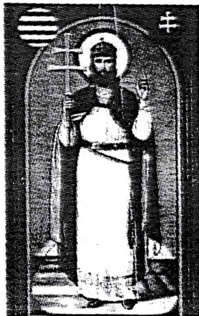
Szent István király, könyörögj érettünk!

Augusztus 20-án ünnepeljük Szent Istvánt, a magyarok első királyát. A magyarok Szent Istvánnak köszönik, hogy katolikus keresztények lettek és így az európai országok befogadták Magyarországot. Szent Istvánnak köszönjük az első alkotmányt, ami jól szabályozta az országot. Szent István hívta az országba a bencés szerzeteseket. Ők megtanították a magyarokat írásra, olvasásra, földművelésre, állattenyésztésre. Szent István ajánlotta a királyi koronát Szűz Máriának és kérte, hogy Szűz Mária védje, segítse a magyarokat. Így lett Magyarország Mária országa.