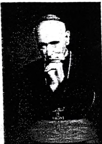
Dr. László Lékai

Mindszenty buzgó pap volt, nagy szeretettel foglalkozott a hívekkel. A cigányok válásoktatását megindította. Jó író is volt. Először veszpremi püspök volt a fasiszta időben. Tiltakozott a zsidók elhurcolása ellen, ezért a fasiszták letartóztatták és Sopronba szállították, papokkal együtt. A háború befejezése után esztergomi érsek, bíboros lett. A kommunista uralom alatt hősiességgel védte az Egyházat, a hitoktatást, a szerzeteseket. Ezért 1948.