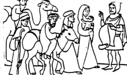
Jézus születése idején is volt népszámlálás.

Az egyházaknak fontos tudni, hogy hány ember tartozik hozzájuk.