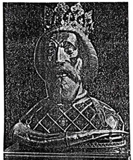
Szent László fejereklyéje