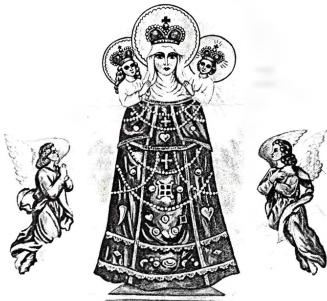
Góra Św. Anny